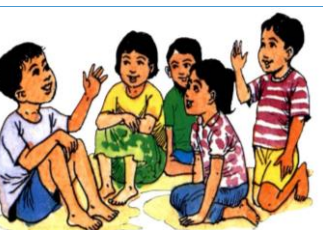
៤.២. ការបង្កើតក្លឹបកុមារ និងសមាគម