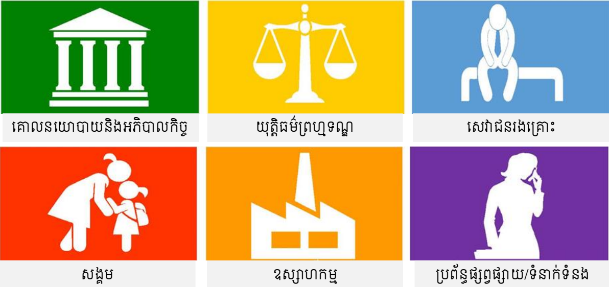
រូបភាពទី៥៖ ការឆ្លើយតបថ្នាក់ជាតិគំរូ (Model National Respond_MNR)

សេចក្តីថ្លែងការណ៍សកម្មភាពសកល (WePROTECT) ឆ្នាំ២០១៥ បានបង្កើតយន្តការឆ្លើយតបថ្នាក់ជាតិគំរូ (MNR) ដែលសង្កត់ធ្ងន់លើសារសំខាន់នៃការចូលរួមរបស់អ្នកពាក់ព័ន្ធនានា និងកំណត់នូវឧស្សាហកម្មពាក់ព័ន្ធចំងនៅក្នុងកិច្ចការពារកុមារតាមប្រព័ន្ធអនឡាញ។ យន្តការឆ្លើយតបថ្នាក់ជាតិគំរូ (MNR) មាន៖ ១.គោលនយោបាយនិងអភិបាលកិច្ច (ការប្តេជ្ញាចិត្តខ្ពស់ក្នុងកិច្ចបង្ការនិងការឆ្លើយតប) ២.យុត្តិធម៌ព្រហ្មទណ្ឌ (ការស៊ើបអង្កេតកាត់ទោសដោយជោគជ័យនិងប្រសិទ្ធភាព និងការគ្រប់គ្រងជនល្មើស) ៣.សេវាជនរងគ្រោះ (វិធានការរក្សាសុវត្ថិភាពសម្រាប់កុមារនិងយុវជន) ៤.សង្គម (ការកេងប្រវ័ញ្ចនិងរំលោភបំពានផ្លូវភេទត្រូវបានបង្ការ) ៥.ឧស្សាហកម្ម (ផ្នែកឧស្សាហកម្មចូលរួមក្នុងការបង្កើតដំណោះស្រាយបង្ការ និងលុបបំបាត់ការកេងប្រវ័ញ្ចផ្លូវភេទលើកុមារតាមប្រព័ន្ធអនឡាញ) និង ៦.ប្រព័ន្ធផ្សព្វផ្សាយ និងទំនាក់ទំនង (ចំណេះដឹងត្រូវបានលើកកម្ពស់សម្រាប់សាធារណៈជន អ្នកជំនាញ និងអ្នកធ្វើច្បាប់ និងគោលនយោបាយ)។