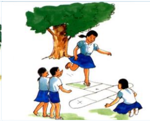
២.២. ការលេងកំសាន្ត និងលំហែ