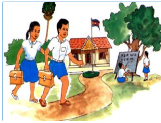
២.១. ការទទួលបានការអប់រំ