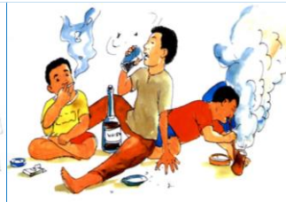
៣.២. ការការពារអំពីការប្រើប្រាស់គ្រឿងញៀន