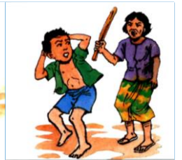
៣.៤. ការការពារអំពីអំពើហិង្សាគ្រប់ប្រភេទ

សិទ្ធិក្នុងការចូលរួម៖ កុមារមានសិទ្ធិចូលរួមបញ្ចេញមតិយោបល់លើបញ្ហា ឬសកម្មភាពដែលមានឥទ្ធិពលដល់ដំណើរជីវិតរបស់ពួកគេ ចូលរួមសកម្មភាពក្នុងសមាគម និងការប្រជុំនានា និងចូលរួមទទួល និងផ្សព្វផ្សាយព័ត៌មាន អានសៀវភៅ កាសែត ទស្សនាវដ្តី ស្តាប់វិទ្យុ មើលទូរទស្សន៍ ដើម្បីពង្រីកការយល់ដឹង និងចេះប្រើវិចារណញ្ញាណវិះគិតចំពោះព្រឹត្តិការណ៍ផ្សេងៗ។ ៧