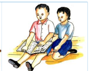
៤.៤. ការយល់ដឹងពី អ.ស.ក