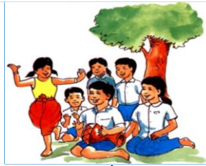
២.៣. ការសម្លែងសិល្បៈ វប្បធម៌