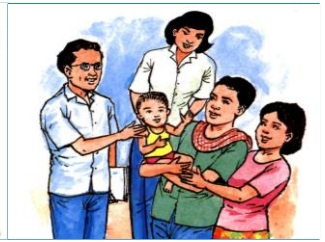
២.៤. ការស្រឡាញ់ថ្នាក់ភ្នំ

សិទ្ធិទទួលបាននូវការការពារ៖ ឪពុកម្តាយត្រូវមើលថែរក្សានិងប្រៀនប្រដៅកុមារ ហើយអាជ្ញាធរគ្រប់លំដាប់ថ្នាក់ ត្រូវចាត់វិធានការជួយកុមារឱ្យរួចផុតពីគ្រោះមហន្តរាយនានាដូចជា គ្រឿងញៀន ល្បែងអោយមុខ អំពើអនាថារ ការរើសអើង ការសេពកាមគុណលើកុមារ ការធ្វើអាជីវកម្មលើកុមារ ការលក់ដូរកុមារ និងអំពើដទៃទៀតដែលប៉ះពាល់ដល់ផលប្រយោជន៍ធំបំផុតរបស់កុមារ។ ឪពុកម្តាយត្រូវការពារកូនរបស់ខ្លួន និងចូលរួមចំណែកការពារកុមារពីការរំលោភទាំងឡាយដែលអាចកើតមានពីអាជ្ញាធរមូលដ្ឋានឬអាជ្ញាធរជាតិ។ គេអាចបង្កើតសមាគមមាតាបិតានៅក្នុងសហគមន៍មូលដ្ឋានក្នុងគោលបំណងការពារសិទ្ធិកុមារ។ អាជ្ញាធរមូលដ្ឋានក៏មានភារកិច្ចការពារកុមារពីការរំលោភនានាដែលអាចប្រព្រឹត្តដោយឪពុកម្តាយ ឬអាណាព្យាបាលរបស់កុមារ និងអ្នកមានអំណាចលើកុមារផ្សេងៗទៀតផងដែរ។ ៦