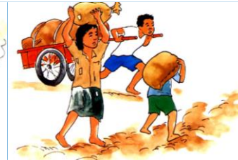
៣.៣. ការការពារអំពីការធ្វើពលកម្មធ្ងន់ធ្ងរ