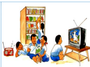
៤.៣. ការចូលរួមផ្សព្វផ្សាយ និងទទួលព័ត៌មាន