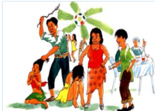
៣.១. ការការពារពីការកេងប្រវ័ញ្ចផ្លូវភេទ