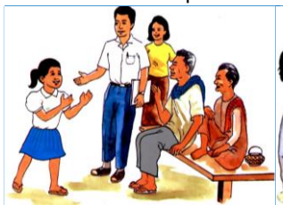
៤.១. ការបញ្ចេញមតិយោបល់